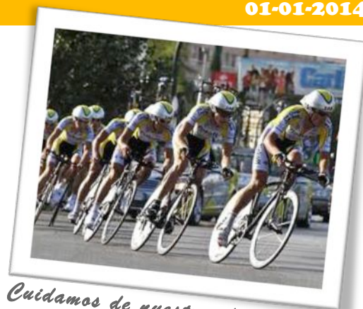
Cuidamos de nuestros federados

La compañía conforme a las coberturas existentes en la póliza contratada, procederá a determinar la existencia, o no, de responsabilidad imputable al federado implicado en los hechos, siempre y cuando